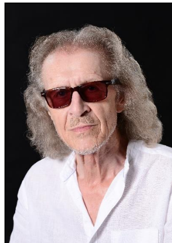
(2018, als 73-jähriger Rentner)