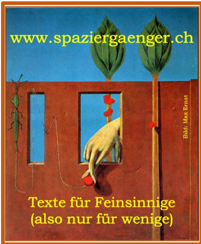
Bild: Max Ernst

Texte für Feinsinnige (also nur für wenige)